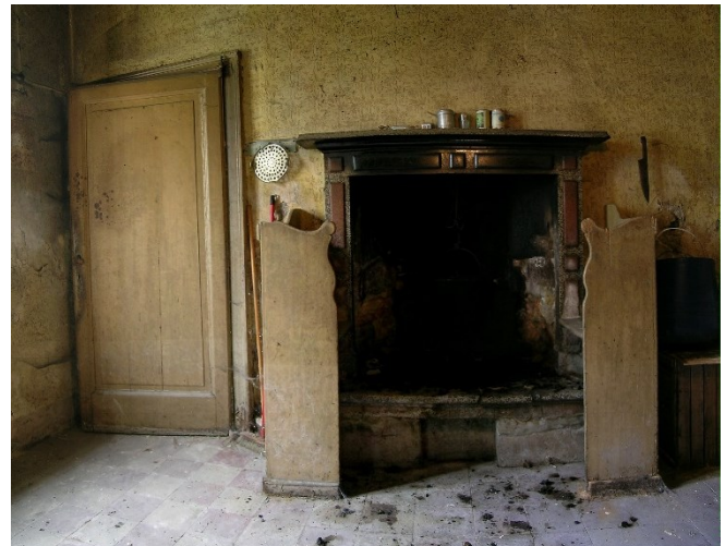
Alcune testimonianze del passato