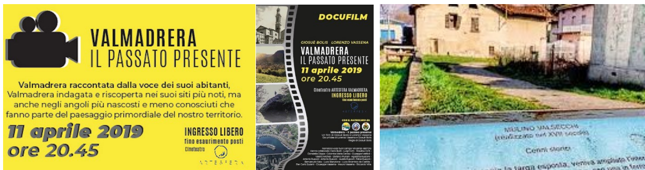
Locandina di uno spettacolo organizzato per "raccontare" Valmadrera – la targa posta dall'Associazione

L'intervento sarà attuato a cura del Comune di Valmadrera, ma interesserà diverse realtà presenti sul proprio territorio, soprattutto interessate a tenere viva la memoria storica delle attività che hanno reso la Città un fulcro dell'operosità del passato. Il gruppo "Volontari Valmadreresi", dopo aver valorizzato un'antica fornace e alcune aree di particolare significato storico situate lungo i sentieri che circondano la cittadina, ha già realizzato un cartello informativo a disposizione dei residenti e dei passanti, dopo aver effettuato una pulizia della vegetazione spontanea presso l'antico Mulino Valsecchi.