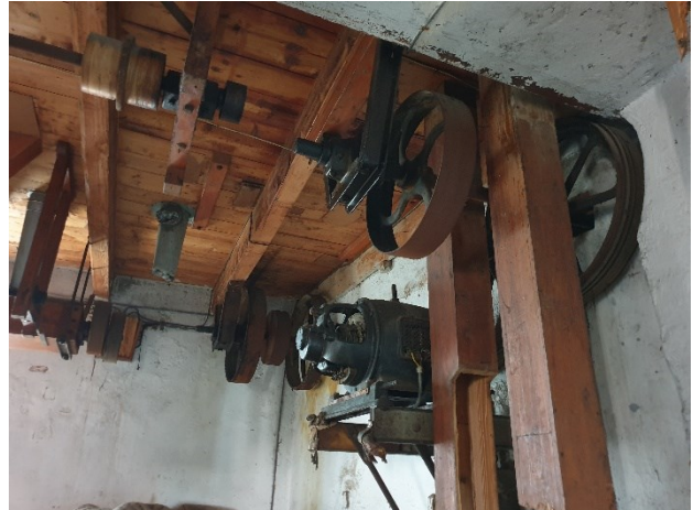
I macchinari interni