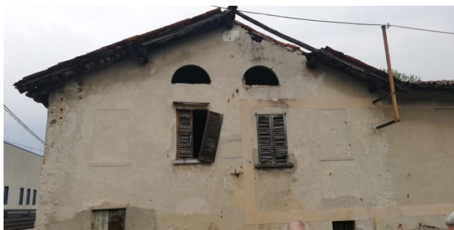
Il frontone del Mulino con la targa con la data di ampliamento

L'interno, di particolare interesse, mantiene integri strutture e macchinari. Fino al 1970 circa il Mulino ha prodotto esclusivamente farina bianca.