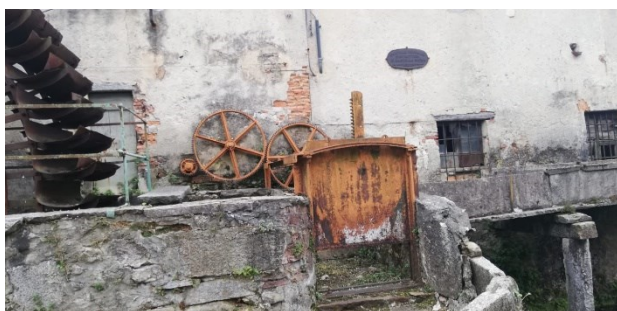
Le prese di acqua derivanti dal Torrente Inferno