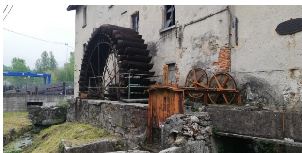
La ruota metallica che ha sostituito la vecchia ruota in legno